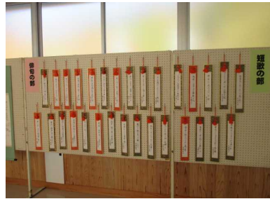
✿ 文化展 作品の展示 ✿