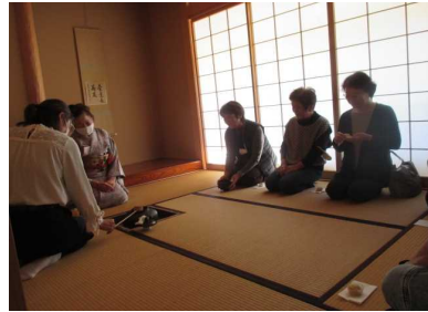
✿ 文化展 茶道部の「おもてなし」 ✿