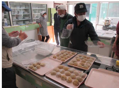
✿ 枳餅作り教室 餡餅作り ✿